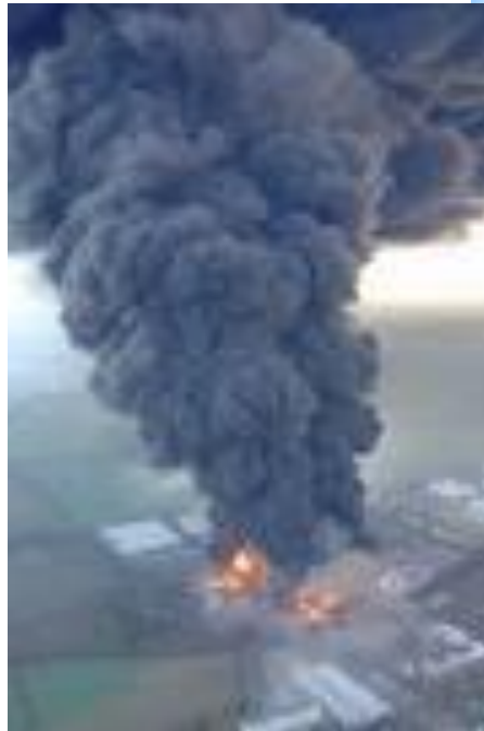
استراتژی های جنگ نامتقارن: